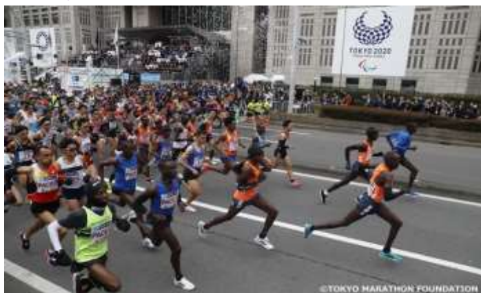
東京車站終點空中俯瞰景象